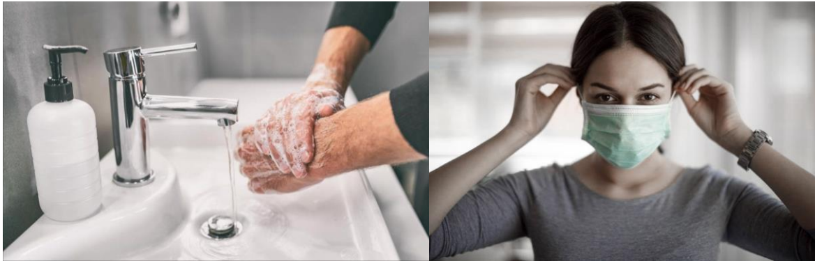
Lavado de manos