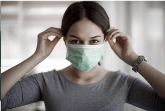
Uso correcto de mascarilla