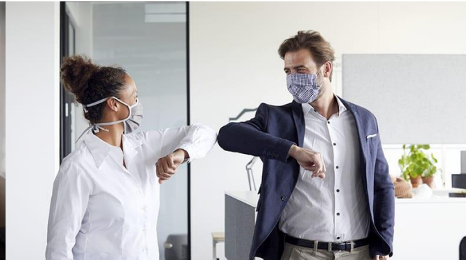
Mantener el distanciamiento físico y ventilación