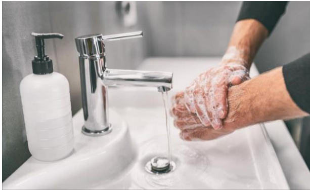
Lavado de manos