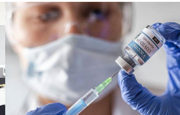
Vacunas salvan vidas