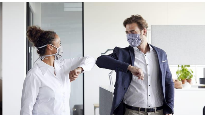
Mantener el distanciamiento físico y ventilación